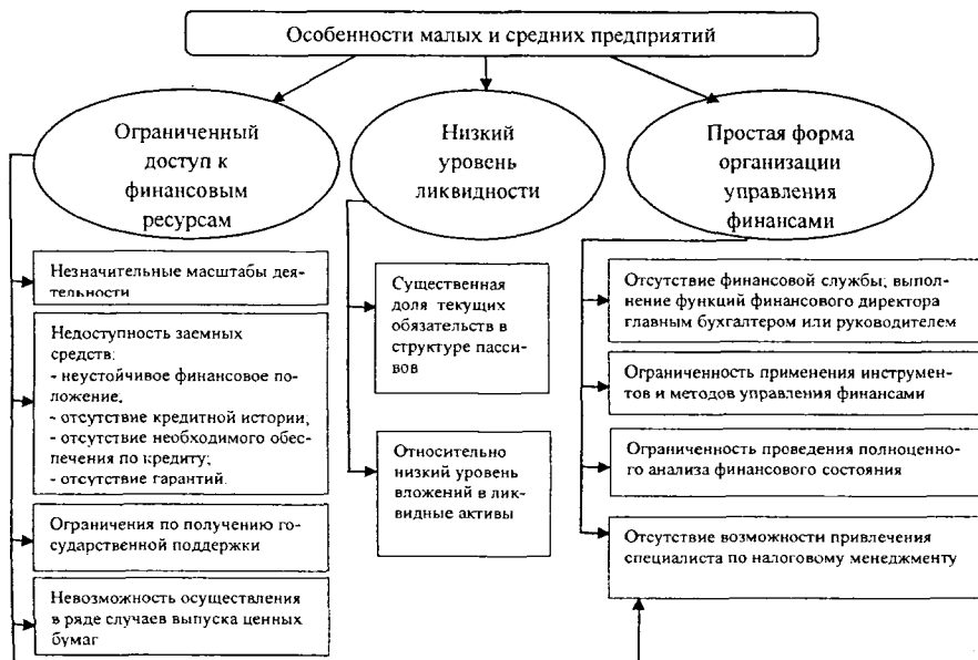
Рисунок 2. Отличительные особенности малых и средних предприятий

Малые и средние предприятия испытывают особые трудности в своем становлении и развитии, в частности: недостаток собственных средств для развития бизнеса, усложненные процедуры кредитования, отсутствие финансового планирования, несовершенство нормативно-правовой базы, регулирующей деятельность малых и средних производственных предприятий и др., в связи с чем нам представляется необходимым выделение отличительных особенностей предприятий малого и среднего бизнеса (Рисунок 2) для последующей детализации угроз их финансовой безопасности.