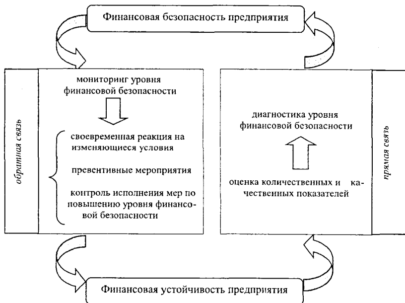
Рисунок 1. Взаимосвязь финансовой устойчивости и финансовой безопасности предприятия

диагностикой ее уровня, а также формированием комплекса превентивных и контрольных мероприятий.