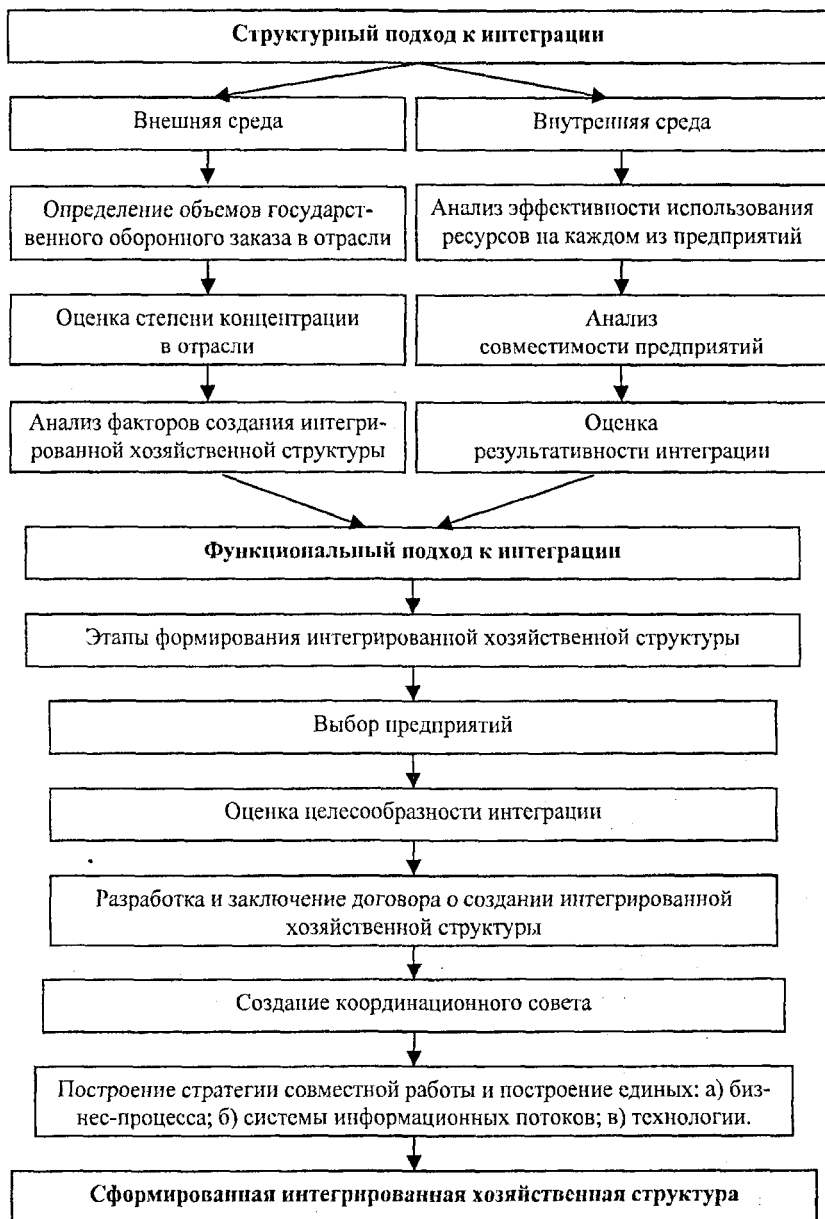
Рис. 2. Структурно-функциональный подход к интеграции