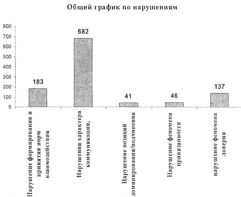
Гистограмма 1. Соотношения нарушений в межвидовых группах

Разработанная нами схема экспертизы взаимодействия владельцев со своими питомцами, состоящая из карты наблюдения и структурированного интервью, позволила получить следующие результаты на репрезентативной выборке.