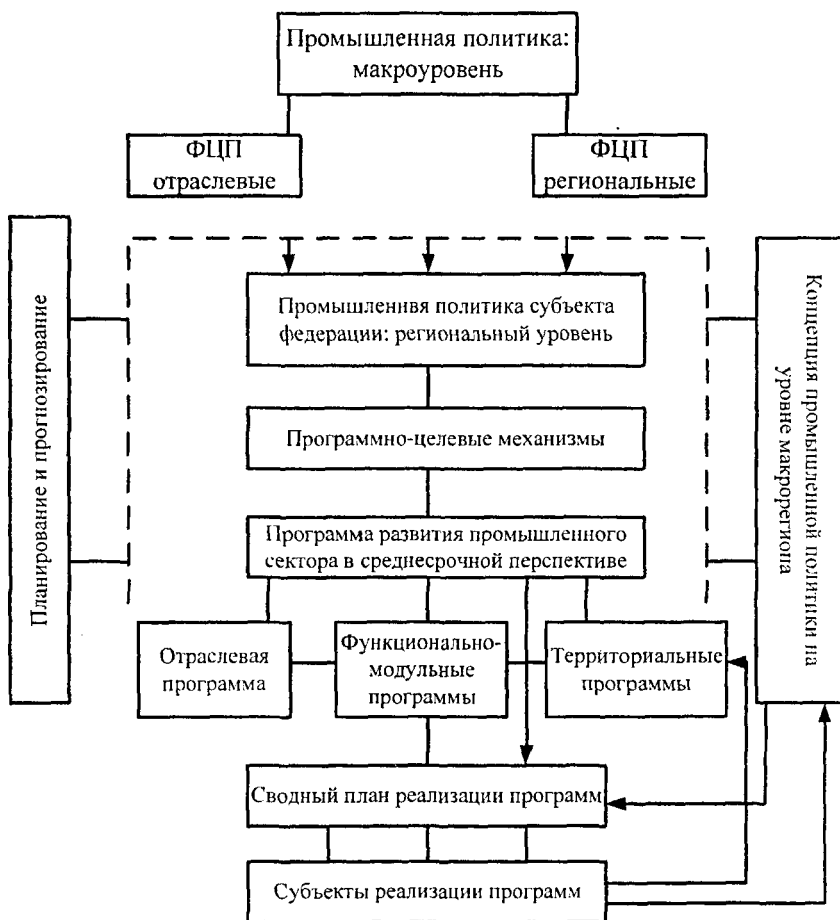
Рисунок 1 – Организационные механизмы реализации промышленной политики на различных уровнях территориального устройства 4

Использование программ в качестве механизма реализации промышленной политики в контексте устойчивого развития промышленного сектора основывается на концепции распределенного децентрализованного управления, в соответствии с которой роль органов управления повышается в части координации и сбалансирования муниципальных и отраслевых планов