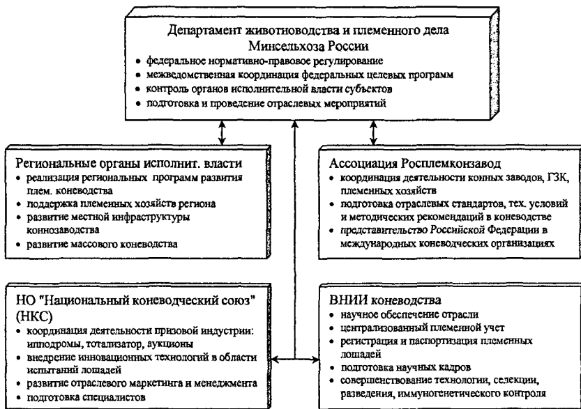
Рис. 2. Структура управления племенным коневодством

Управление отраслью по предлагаемой схеме позволит избежать подобных коллизий, будет способствовать повышению эффективности управленческих решений и динамичному развитию объекта управления – предприятий занятых в племенном коневодстве.