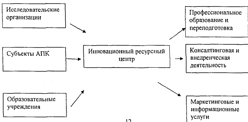
Рисунок 1. Схема организации инновационного ресурсного центра

Организационной формой призванной сочетать интересы сторон должны стать некоммерческие партнерства, формируемые на федеральном и региональном уровне (региональные инновационные ресурсные центры). Они являются ядром регионального профессионального сообщества, выполняя в этом качестве следующие функции: 1. концентрация отраслевых знаний, технологий и информационных ресурсов; 2. концентрация консалтинговых, образовательных, исследовательских и опытно-внедренческих услуг для отрасли; 3. цивилизованное лоббирование интересов отрасли на региональном уровне и организация эффективного диалога с региональной и местной властью; 4. налаживание неформализованного общения представителей отраслевой науки, образования с работодателями.