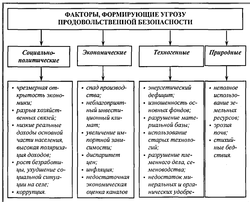
Рис. 1. Факторы, формирующие угрозу продовольственной безопасности

Величина данного коэффициента, равная единице, означает, что регион полностью самообеспечен продовольствием. В противном случае он нуждается в импорте продовольствия из других регионов или из-за рубежа.