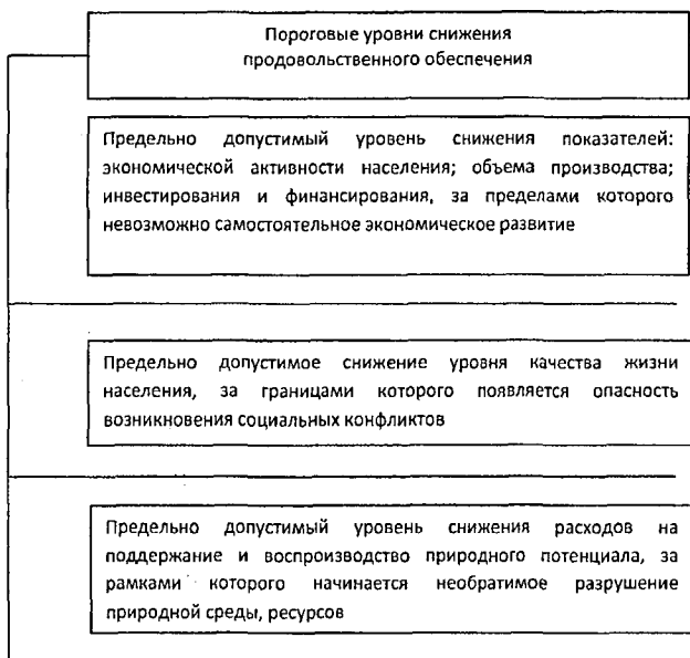
Рисунок 4 – Пороговые уровни снижения продовольственного обеспечения

В работе предложены пороговые уровни снижения продовольственного обеспечения характеризуются системой показателей общехозяйственного, социально-экономического, эколого-экономического значения (см. рис. 4).