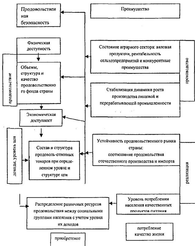
Рисунок 2 – Взаимозависимость социально-экономических показателей, определяющих продовольственную безопасность

Экономическую доступность продовольствия рассмотрена в работе также как аспект распределения различных ресурсов продовольствия между различными социальными группами населения и регионами страны. Физическая и экономическая доступность выражается в отношении фактического показателя к нормативному или базовому за определенный период времени (См. Рис. 2).