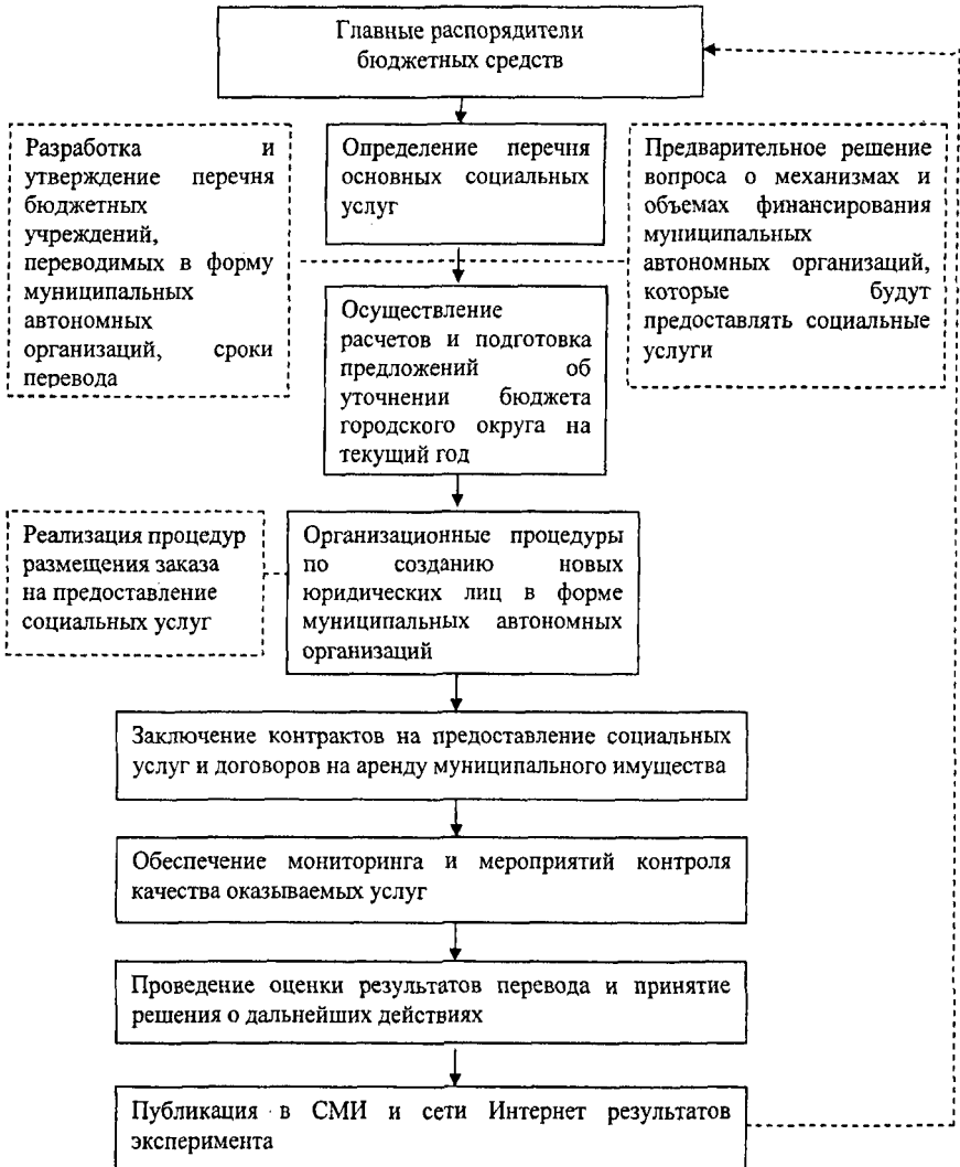
Рис. 2. Алгоритм перевода традиционных бюджетных организаций и учреждений, предоставляющих социальные услуги, в форму муниципальных автономных организаций

предоставлением муниципальных услуг. Один из способов - перевод традиционных бюджетных организаций, предоставляющих социальные услуги, в форму муниципальных автономных учреждений (рис. 2).