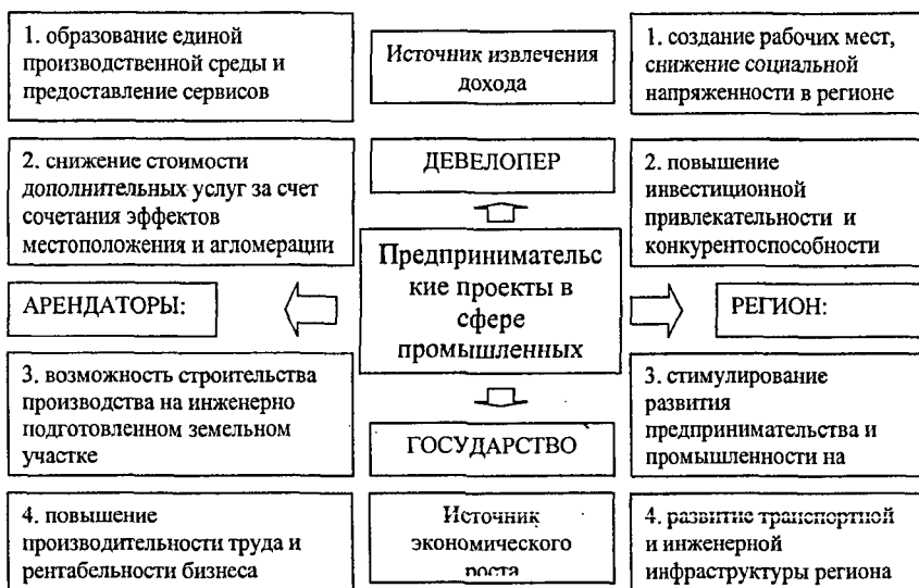
Рис. 2 - Социально-экономические эффекты от реализации предпринимательских проектов в сфере промышленных парков

В диссертации обосновано стратегическое значение девелоперских предпринимательских проектов в сфере промышленных парков для развития инновационного и наукоемкого промышленного производства и выявлены долгосрочные социально-экономические эффекты от реализации данных проектов (Рис. 2).