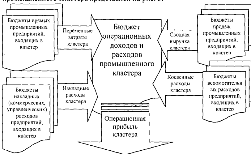
Рис. 1. Алгоритм формирования сводного бюджета операционных доходов и расходов кластера

Для эффективного управления региональным промышленным кластером необходим консолидированный бюджет (финансовый план), учитывающий особенности взаимодействия предприятий. Составление сводного финансового плана по кластеру в целом позволяет прогнозировать возможные изменения и принимать своевременные меры по снижению их отрицательного воздействия. Алгоритм формирования сводного бюджета доходов и расходов промышленного кластера представлен на рис. 3.