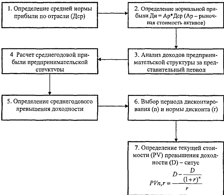
Рис.2. Метод дисконтирования.

В третью группу методов , мы включили методы основанные на сравнении. Типичным представителем этой группы является метод аналогии. Метод основывается на ценовых измерителях некоторого числа среднегодовых доходов предшествующих 2-3 лет, которые были получены другими компаниями этой же отрасли, в случаях, когда компании были проданы. Простота