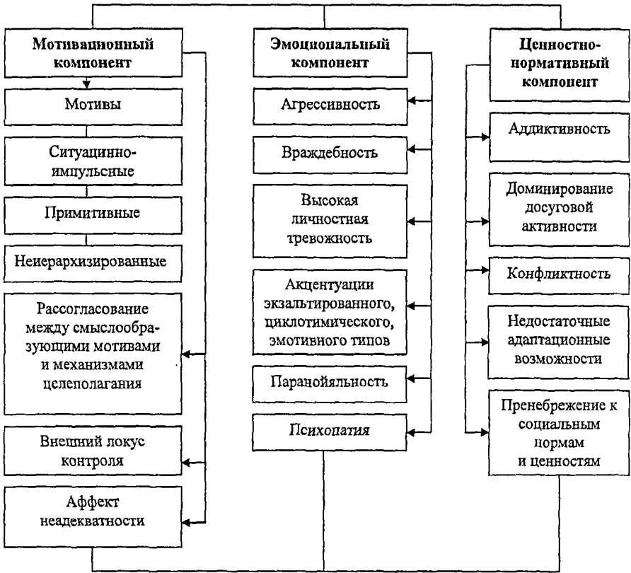
Рис.2. Модель личности подростков с делинквентным поведением

Таким образом, подросткам-делинквентам необходима психолого-педагогическая поддержка с акцентом на усвоение общечеловеческих ценностей, на освоение ими просоциальных алгоритмов поведения, помощь в регуляции эмоциональных состояний. Серьезной помехой в психологическом воздействии на личность подростков-делинквентов является недостаточный воспитательный ресурс семьи (дефицит событийной общности), пристрастие молодых людей к алкоголю и наркотикам (аддиктивная направленность), они подвергаются физическому насилию со стороны сверстников и взрослых (закрепление агрессивных паттернов поведения). Полученные в ходе исследования данные послужили основанием к разработке коррекционной программы личностных особенностей подростков с делинквентным поведением.