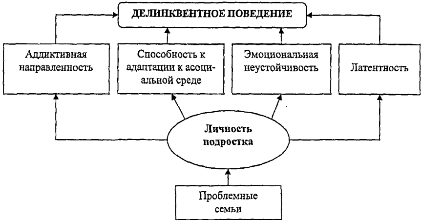
Рис. 1. Факторная модель условий, определяющая направленность личности подростков экспериментальной группы

Подростки-делинквенты постоянно находятся в состоянии эмоционального напряжения, что в любой момент может проявиться в агрессивных действиях, суицидных попытках, побегах из дома, совершении противоправных действий. Наказания подростков-делинквентов в семье преимущественно не являются определяющим для коррекции поведения ( r = -0,37 ). В случае же физического и морального насилия над подростками можно говорить о невозможности адекватно ими воспринимать предъявляемые требования ( r = 0,68 ). Вместе с тем, у подростков-делинквентов сохраняются переживания за свои неблагоприятные поступки ( r = 0,66 ). Это говорит о возможности и необходимости коррекции эмоциональных состояний, оказания им психолого-педагогической поддержки.