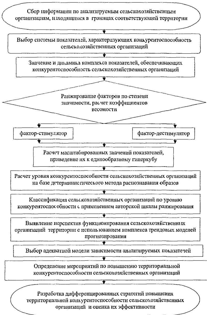
Рисунок 2 – Алгоритм формирования и оценки эффективности дифференцированных экономических стратегий повышения территориальной конкурентоспособности сельскохозяйственных организаций муниципального района