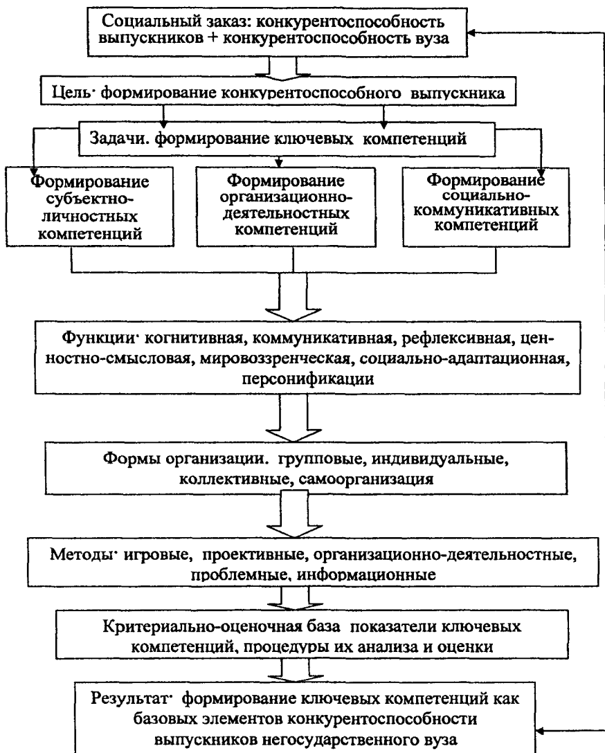
Педагогическая модель формирования конкурентоспособности выпускников негосударственного вуза