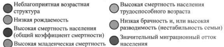
Рис. 3. Демографическая ситуация в городах областного подчинения и районах Пензенской области в 2004 году