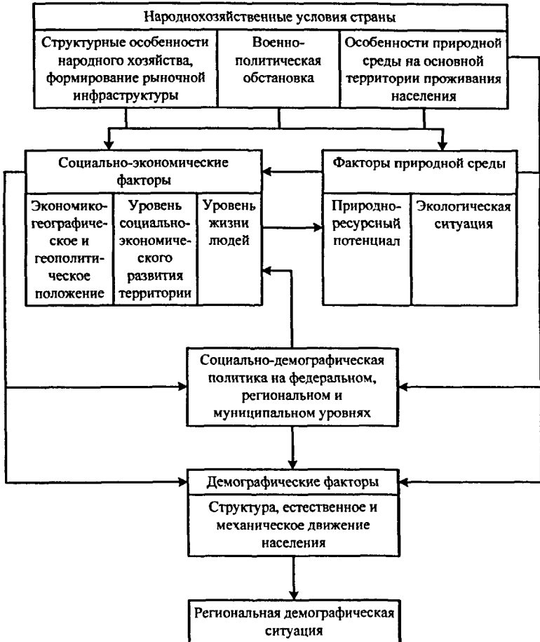
Рис. 1 Условия и факторы развития региональной демографической ситуации

Формирование региональной демографической ситуации происходит на фоне общих народнохозяйственных условий страны, включающих особенности военно-политической обстановки, народного хозяйства, рыночной инфраструктуры и природной среды (рис. 1) Уровень социально-экономического развития территории влияет на уровень жизни людей, условия труда, быта, образ жизни, уровень культуры и др. Все это отражается на здоровье, средней продолжительности жизни, показателях воспроизводства населения.