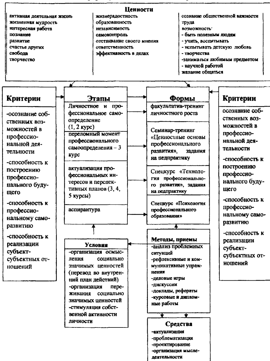
Рисунок № 1. Модель формирования ценностных ориентаций.