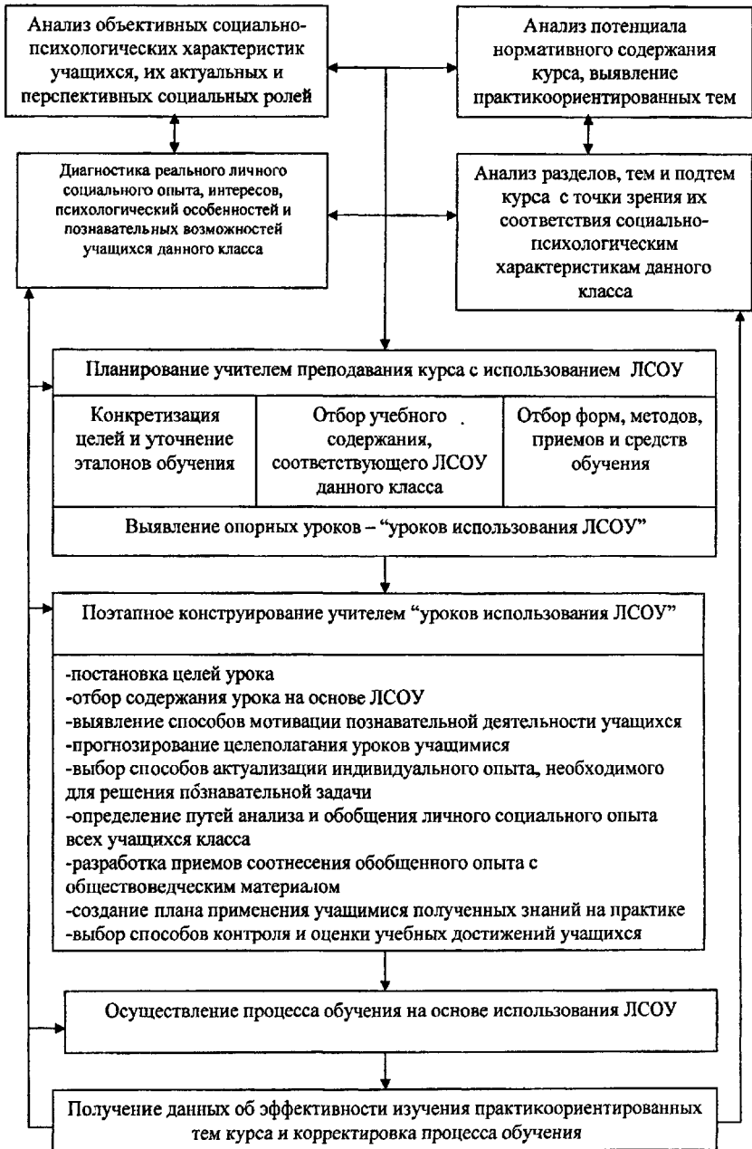
Рис. 1. Модель включения личного социального опыта учащихся (ЛСОУ) в процесс обучения обществознанию