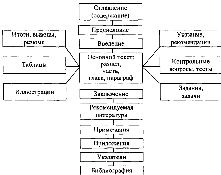
Рис. 2. Структурно-функциональная модель учебного пособия по специальной дисциплине

ном процессе с использованием учебного пособия по специальной дисциплине осуществляется при условии реализации его дидактических функций и структурирования по предлагаемой модели: оглавление (содержание), предисловие, введение, основной текст, таблицы, иллюстрации, указания, рекомендации, вопросы, тесты, задания, задачи, выводы, резюме структурной части, заключение, рекомендуемая литература, примечания, приложения, указатели, библиография. Каждый структурный компонент реализует определенные функции учебного пособия. Целенаправленная организация учебного текста в пособии, соответствующая данной структурно-функциональной модели (рис. 2), управляет развитием ключевых компетенций студентов, их самостоятельной познавательной и исследовательской деятельностью, закономерностями усвоения и применения знаний.