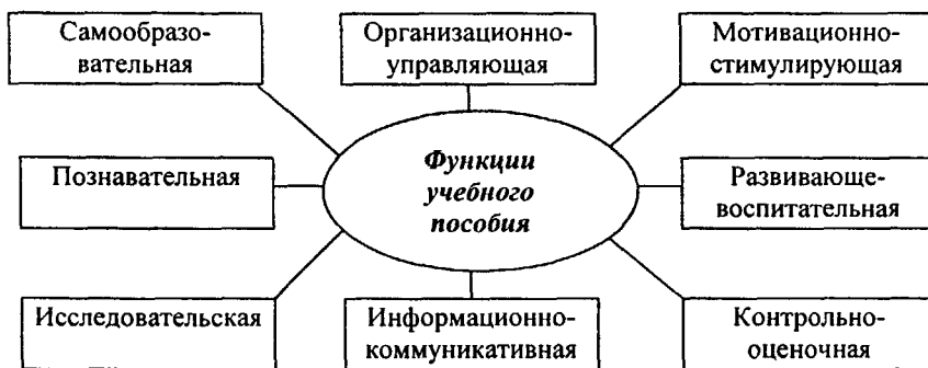
Рис. 1. Функции учебного пособия по специальному курсу

Учебное пособие по специальной дисциплине, адекватное целям и задачам современного вузовского образования, – это полифункциональная дидактическая система, призванная осуществлять целенаправленное управление познавательной деятельностью студентов, формировать их активное отношение к решению различных учебных и профессиональных проблем.